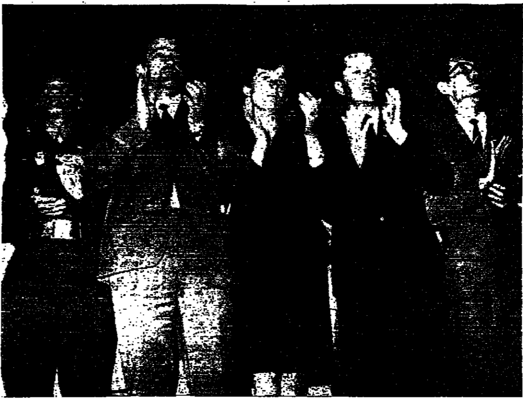
رئيس الوزراء السوري فاضل الخوري... والمرشد الأعلى للثورة السورية بشار الأسد.

جاكوتا - روبرت - ادبي ريجال... الجمارك انزعجت من حجم نهدي المرأة في مطار كيبورون التابع لجمهورية نوريب.